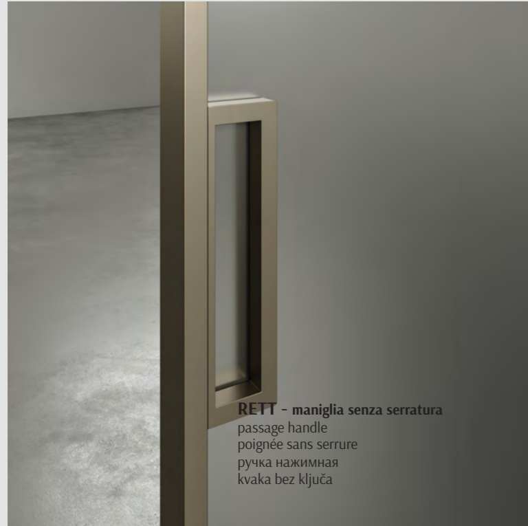
RETT - maniglia senza serratura passage handle poignée sans serrure ручка нажимная kvaka bez ključa