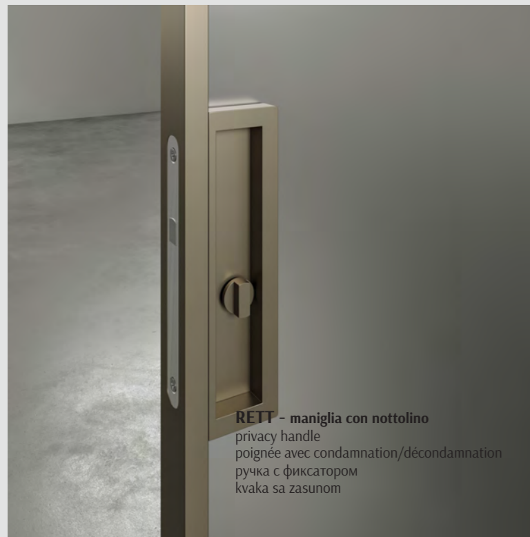
RETT - maniglia con nottolino privacy handle poignée avec condamnation/décondamnation ручка с фиксатором kvaka sa zasunom